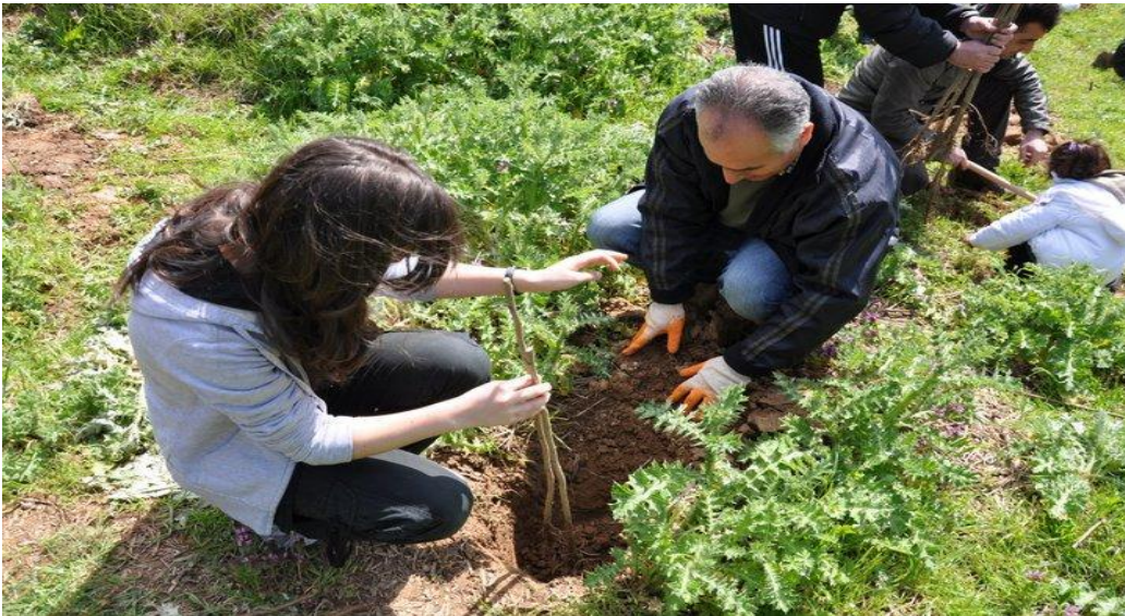
Vefa Ormanı Fidan Dikimi