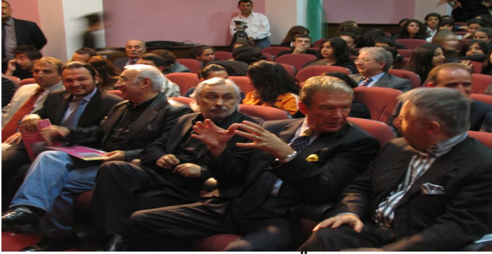
Kemal Sunal Kltr Sanat dlleri Treni