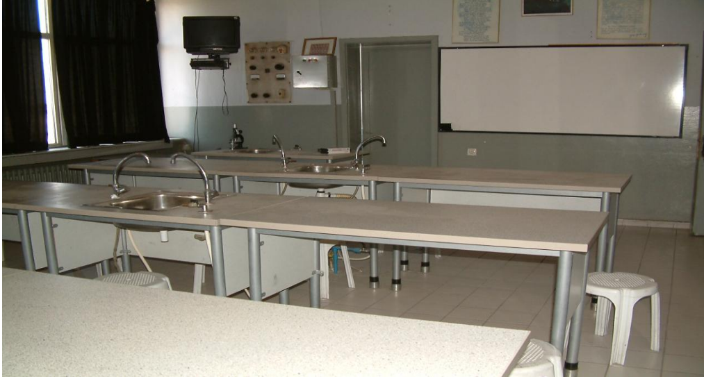
Laboratuar - Kimya