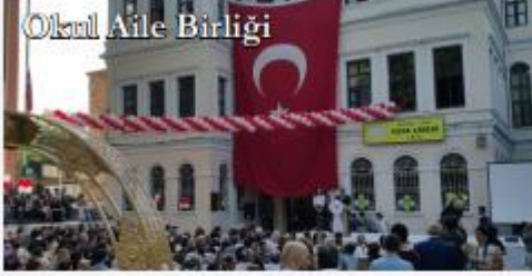
Okul Aile Birliği

Vefa Lisesi velilerince kurulan Okul Aile Birliği'nin amacı: “okul ile aile arasında bütünleşmeyi gerçekleştirmek, veli ve okul arasında iletişimi ve iş birliği sağlamak, eğitim-öğretimi geliştirici faaliyetleri desteklemek, maddi imkanlardan yoksun öğrencilerin zorunlu ihtiyaçları karşılamak ve okula maddi katkı sağlamaktır.”